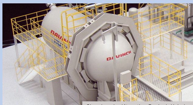
Chambre de détonation Davinch Kobelco

Installation « propre », Sécoia est également une installation moderne offrant les meilleures garanties de sécurité. Ainsi les opérations liées aux munitions chimiques anciennes seront effectuées de manière téléopérée, dans un bâtiment renforcé : le bâtiment procédé. Depuis la salle de commande, des opérateurs hautement qualifiés piloteront à distance la destruction par explosion des munitions. La destruction s'effectuera dans une chambre de détonation étanche et blindée pour contenir les effets mécaniques et chimiques de l'explosion. Ce système, mis au point par la société japonaise Kobelco, est déjà opérationnel dans d'autres pays et a fait ses preuves. Les déchets, débris et gaz issus de la destruction des munitions, seront ensuite neutralisés sur place.