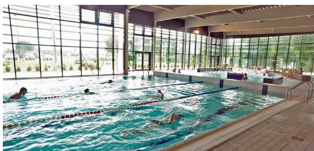
Le centre nautique d'Arcis-sur-Aube

En phase d'exploitation, pendant plusieurs dizaines d'années, le fonctionnement de l'installation Sécoia contribuera à la dynamisation du tissu économique local, avec la création d'emplois, l'intégration dans la région d'une partie du personnel et de leur famille, l'appel à la sous-traitance locale.