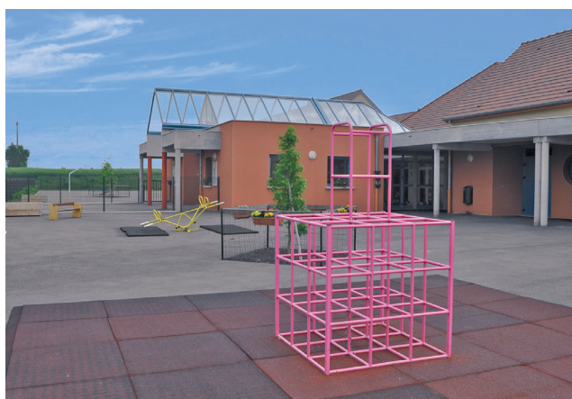
Groupe scolaire de la vallée de Lhuître

En savoir plus sur Sécoia : www.aube.pref.gouv.fr